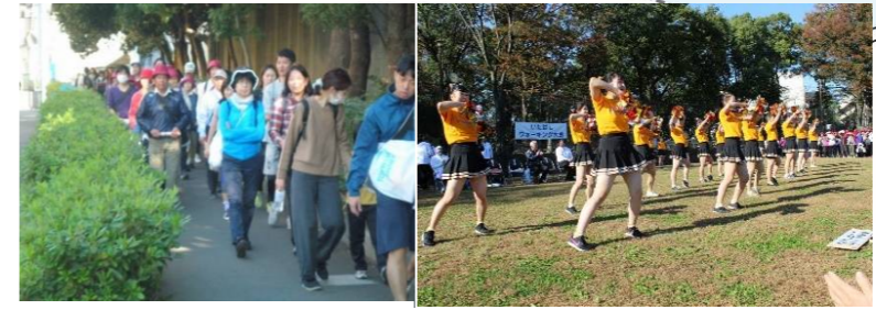
元気いっぱい、歩け歩け 華やかな東京家政大学チアリーディング部のパフォーマンス