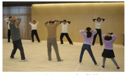
ふるさといたばし体操