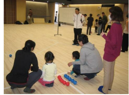
ポッチャ体験の様子

増築工事中だった小豆沢体育館プール棟が完成し、2月1日のオープンに先立ちオープニングイベントが開催されました。プール棟では落成式からはじまり、スイマーによるデモンストレーションが行われました。またアリーナ棟や野球場では、サッカーやバレーボールなどを体験できる、ボールゲームフェスタが催されました。