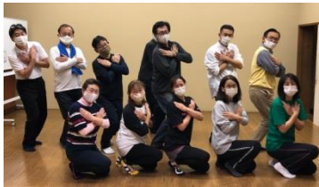
和ヨガ体験 (乙女のポーズ)

今年度は、コロナ禍で中々思うような活動が、できませんでしたが来年度以降、様々な団体との連携を進めていきたいと思えます。